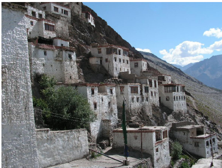
Ensembles de petites maisonnettes, habitations des moines composant entre autre le monastère de Karsha.